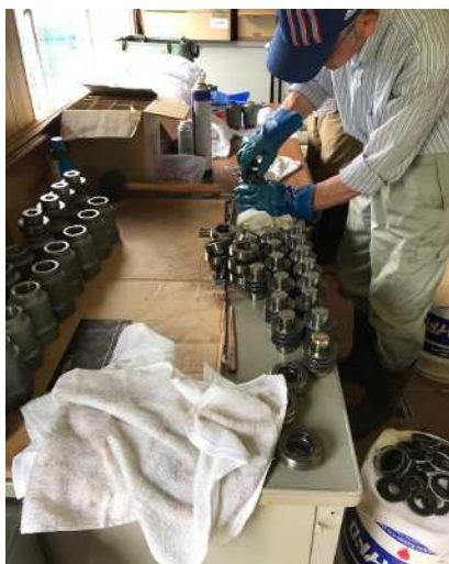
(握索機分解洗浄点検)

春から秋にかけて整備点検を実施、また、シーズン中は1月及び2月にグリースアップ、増締め等を実施しております。