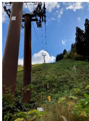
(リフト索輪の点検整備)